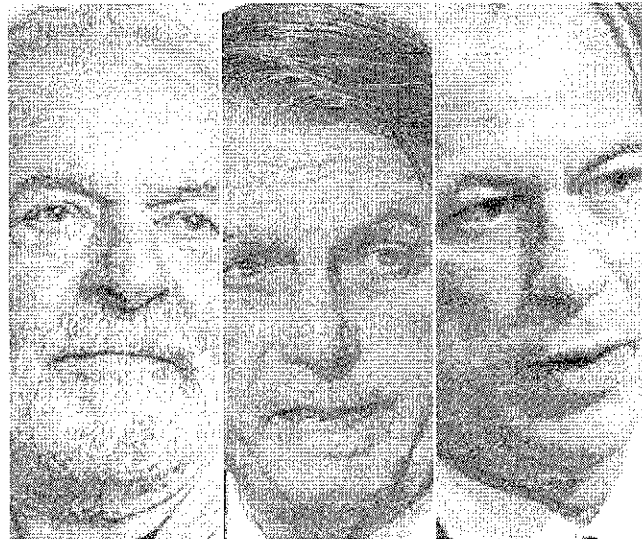
Lula, Bolsonaro e Ciro Gomes |