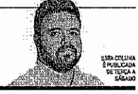
ESTA COLUNA É PUBLICADA DE TERÇA A SÁBADO