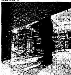
FORCADOS a fechar mais cedo, restaurantes sentem impacto do decreto