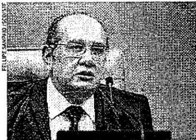
GILMAR Mendes afirmou que atitude do general atenta contra a ordem constitucional

O ministro Gilmar Mendes usou as redes sociais nesta terça-feira, 16, para rebater o ex-comandante do Exército, Eduardo Villas Bôas. Mais cedo, o militar ironizou a reação do ministro Edson Fachin, que subiu o tom no dia anterior contra uma declaração dita por ele há três anos.