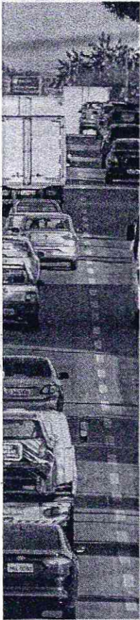
recebimento de do fim de abril

ATÉ 60 DIAS | A implementação da nova forma de de projeto piloto que será submetido a processo licitatório